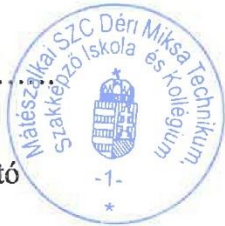
Tóth Éva megbízott igazgató